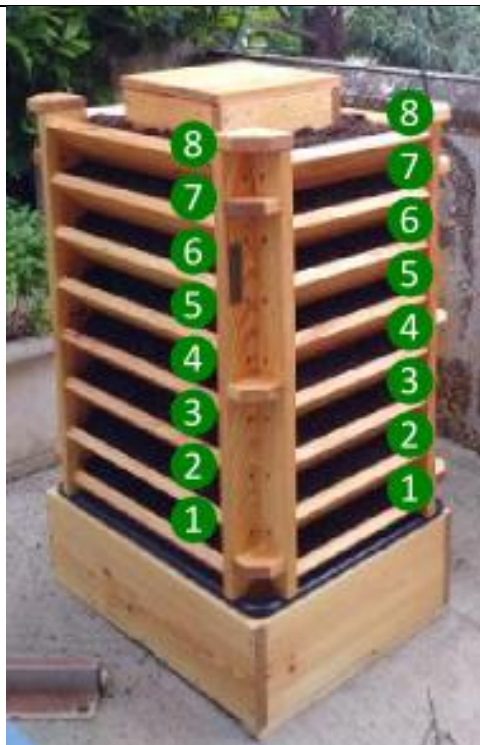
Numérotation des 8 étages de culture

8 : étage supérieur 1 à 7 : étages inférieurs