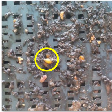
Cocon d'Eisenia contenant 3/4 petits lombrics (ici, sur le côté d'un panier de compostage).